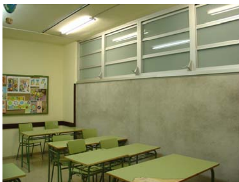
Nova aula de desdoblament, la seva instal·lació elèctrica ha estat realitzada pels alumnes de l'Aula Oberta.