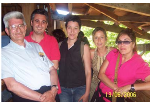
Els professors fent la cua de l'Stampida.

El passat 12 de juny, i prèviament a la realització a l'Institut dels Crèdits de Síntesi, es va fer la tradicional sortida de fi de curs de l'ESO a Port Aventura.