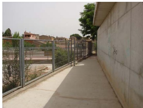
Nou tancament del perímetre del centre.